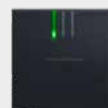
SmartRelais 3 Advanced LED Leser