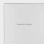
SmartRelais 2 Leser